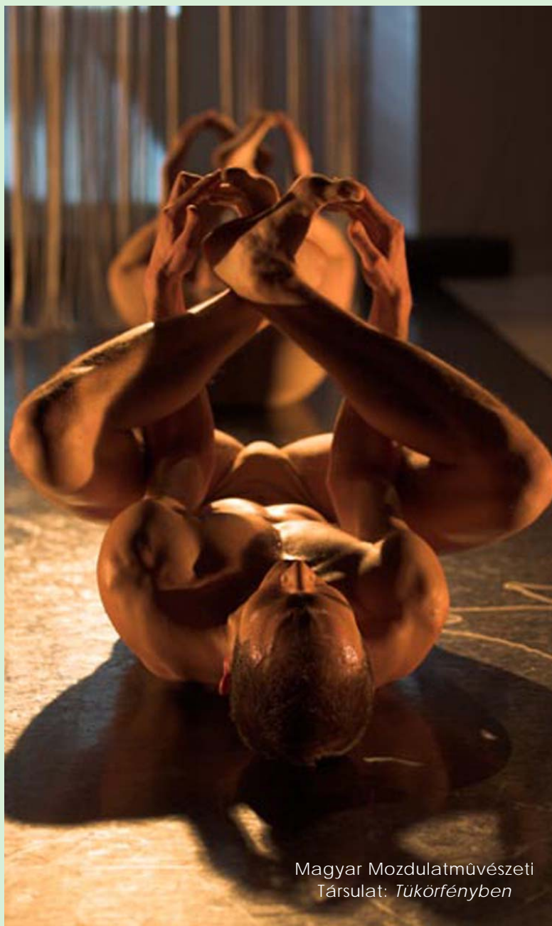
Magyar Mozdulatművészeti Társulat: Tükörfényben